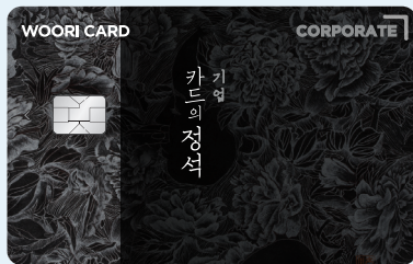
카드의 정석 기업